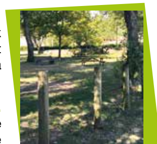
Le square du Brégard - 19 août 2016

Des travaux d'amélioration tels que l'installation de tables de pique-niques, de bancs et d'une structure de jeux sont en cours.