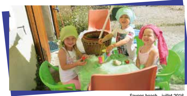
Soyons beach - juillet 2016

→ Vacances scolaires : ouvert à tous mardi, mercredi et vendredi