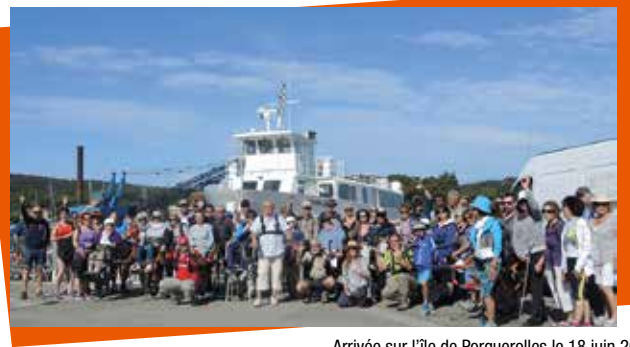
Arrivée sur l'île de Porquerolles le 18 juin 2016