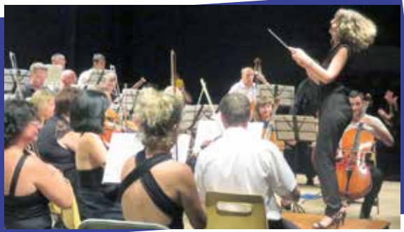
Un chef d'orchestre soyonnais... imprévu-concert du 23 juillet 2016 à Guilhaud-Granges

→ Samedi 5 novembre à 20h30 : « Invitation à la Valse » à la salle des fêtes