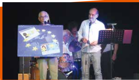
Soirée franco-italienne - 11 juin 2016

Le point fort de cette année fut la venue d'une délégation de Spinadesco, ville jumelle. 24 amis italiens sont arrivés le vendredi 10 juin à Soyons et ont été hébergés par nos adhérents.