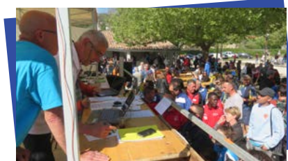
Concours fédéral - 8 et 9 avril 2017

Après l'organisation des championnats départementaux les 8 et 9 avril derniers qui fut une véritable réussite, la Pétanque Soyonnaise poursuit sur sa dynamique et obtient des résultats tout à fait honorables aux divers championnats. Elle organise également des concours officiels qui rassemblent toujours un grand nombre de joueurs mais aussi des rencontres de sociétaires où règne une grande convivialité.