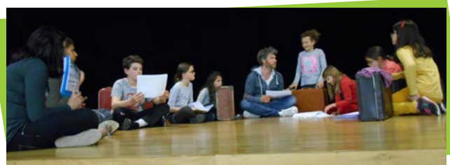
Trétares enfants en répétition

Dès la rentrée 2017 toute l'équipe se lance dans un nouveau programme, avec, pour finalité, une grande fête anniversaire. En 2018, Soyons en chœur fêtera ses 20 ans !