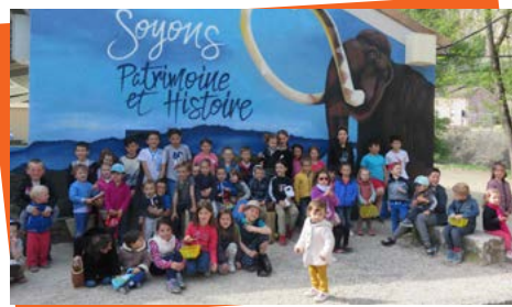
Chasse aux œufs 15 avril 2017