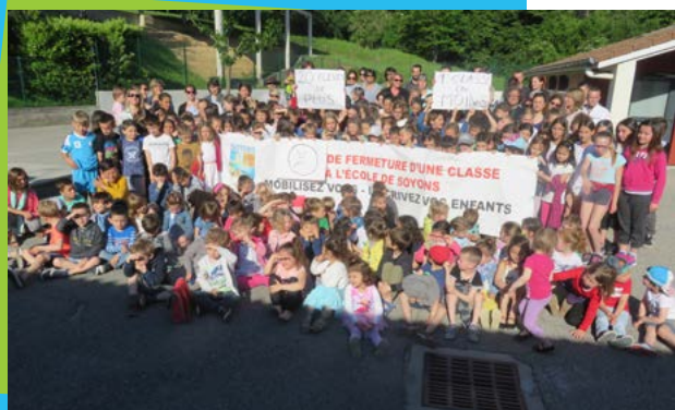
Occupation de l'école - 17 mai 2017