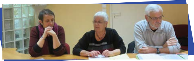
AG du 27 janvier 2017

→ Depuis début mai : Animation « Lisons au Parc » proposée aux enfants les mercredis de 15 h à 16 h. Encore 2 séances le 21 juin et le 5 juillet.