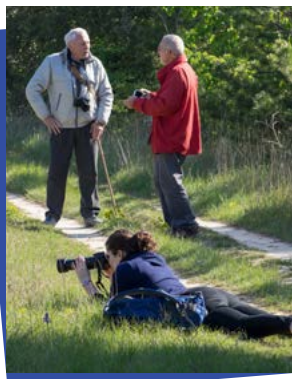
Sortie orchidées plateau de Soyons - 22 avril 2017

Les membres de l'association préparent l'exposition photo qui se déroulera début 2018. Elle aura pour thème « Oublié, abandonné... ». L'objectif consiste à mettre en relief des objets, des outils abandonnés dans la nature, des lieux qui semblent délaissés, des êtres vivants paraissant perdus... Les photos seront le reflet de ce qui n'est plus en état de fonctionner, de ce qui est resté - précisément - en l'état.