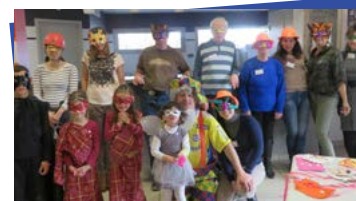
Bal costumé - 26 février 2017

→ Vacances d'été : mardi, mercredi et vendredi, propose ton idée on t'aidera - ou initiation danses du monde ou bien-être. Inscription pour juillet et août.